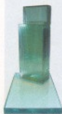
Balanço Anual 2007